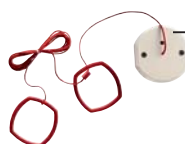
RUF 440 häire tõmbelüliti

Lähtestamisnupp (pimedate punktikirjaga): süsteemi algoleku lähtestamiseks