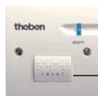
RUF 440 lähtestamisnupp

sinine LED-valgusdiod vilgub: häire on aktiveeritud (+ heli)