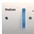
RUF 440 häireindikaator

sinine LED-valgusdiod vilgub: häire on aktiveeritud (+ heli)