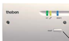
RUF 440 juhtseade