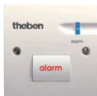
RUF 440 häire surunupp